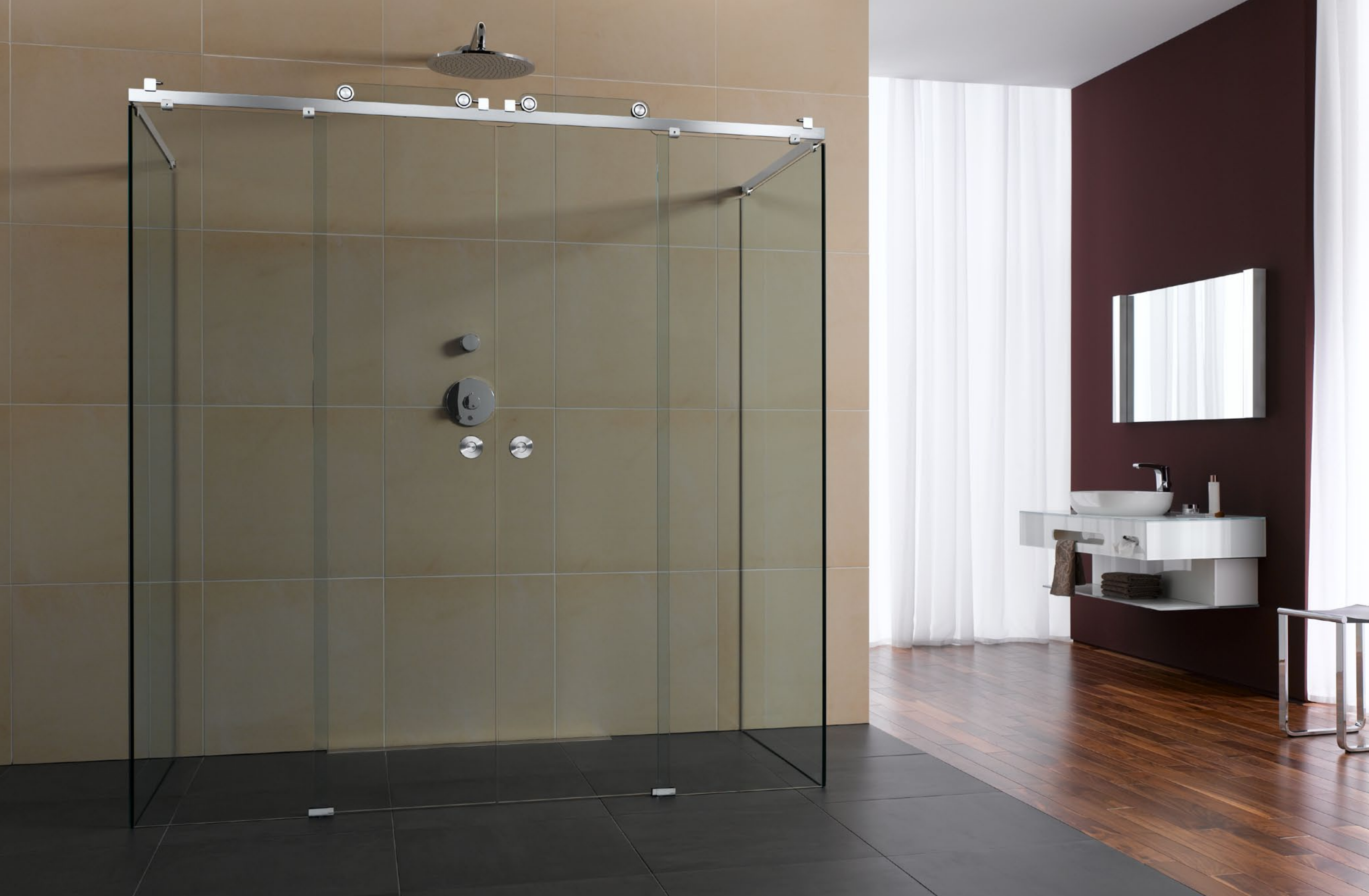
Duschsystem Claro U-Variante mit Fronteinstieg