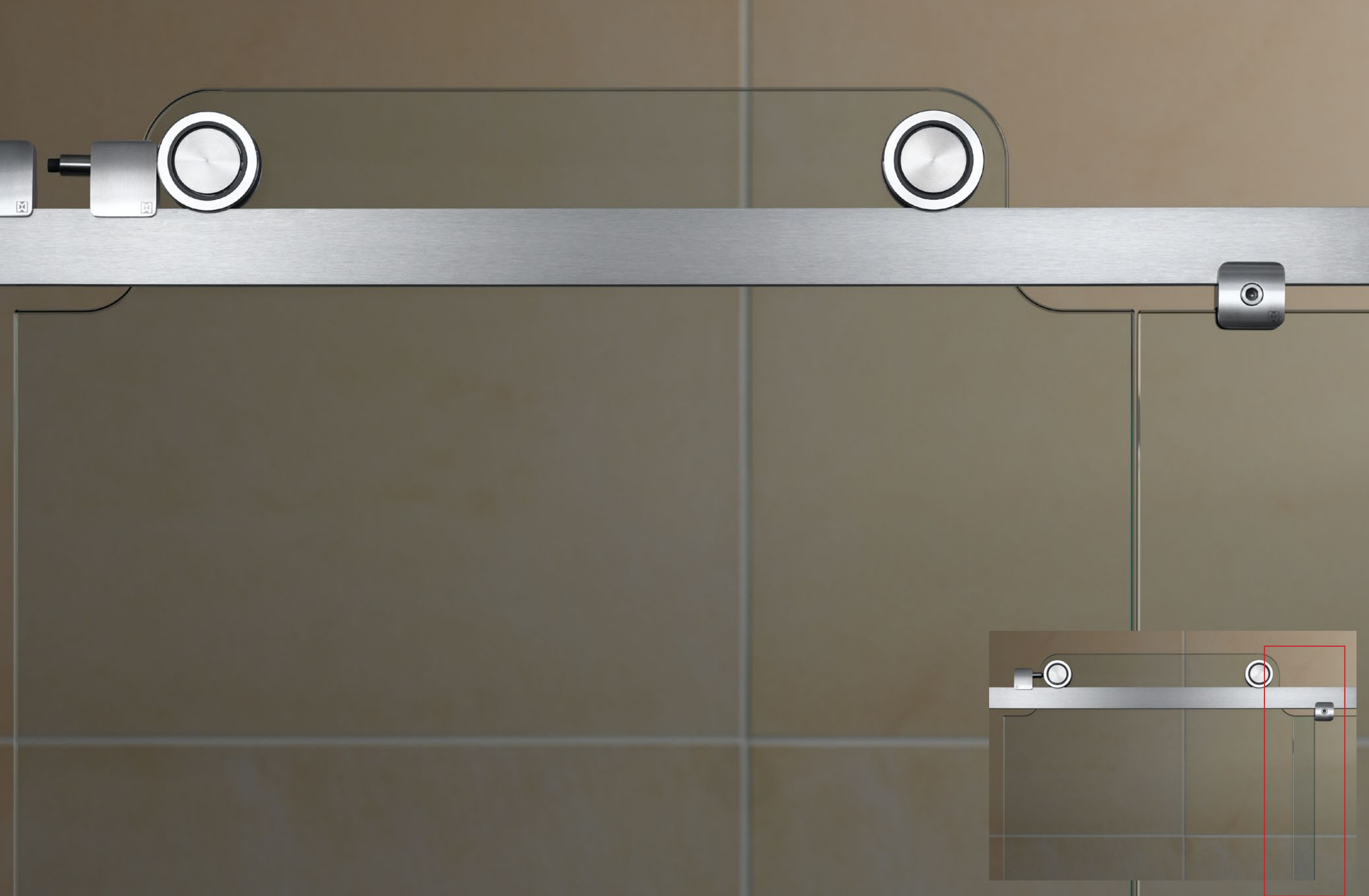
Duschsystem Claro Zum Reinigen kann man bequem den Stopper herausnehmen und die Schiebetür ganz öffnen, so dass der Glasüberstand beseitigt wird