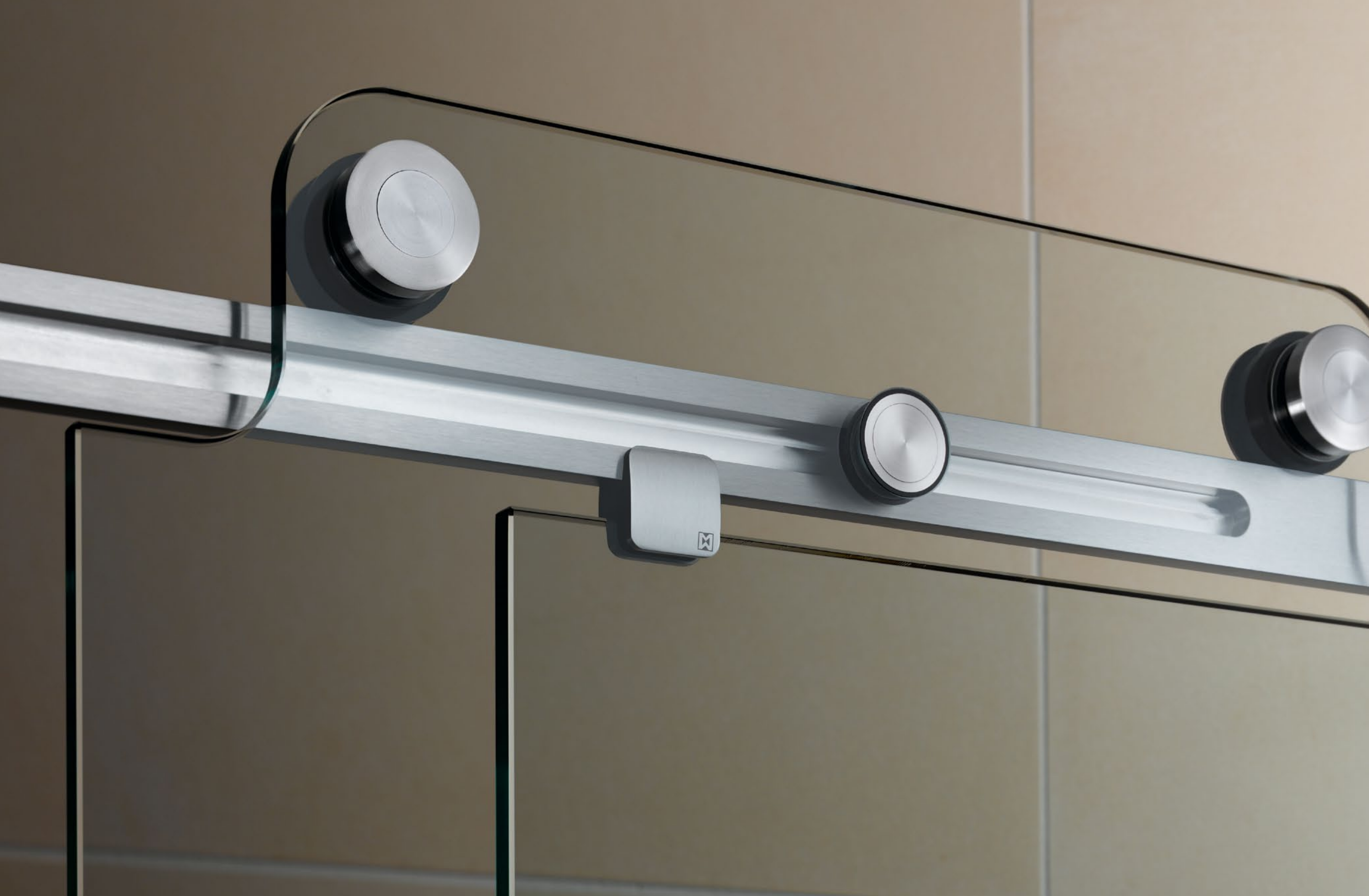
Duschsystem Claro Flachprofilaufschiene aus Vollmaterial!