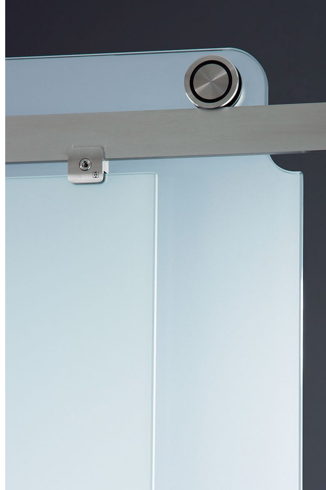
Duschsystem Claro Anwendung als Nischenlösung