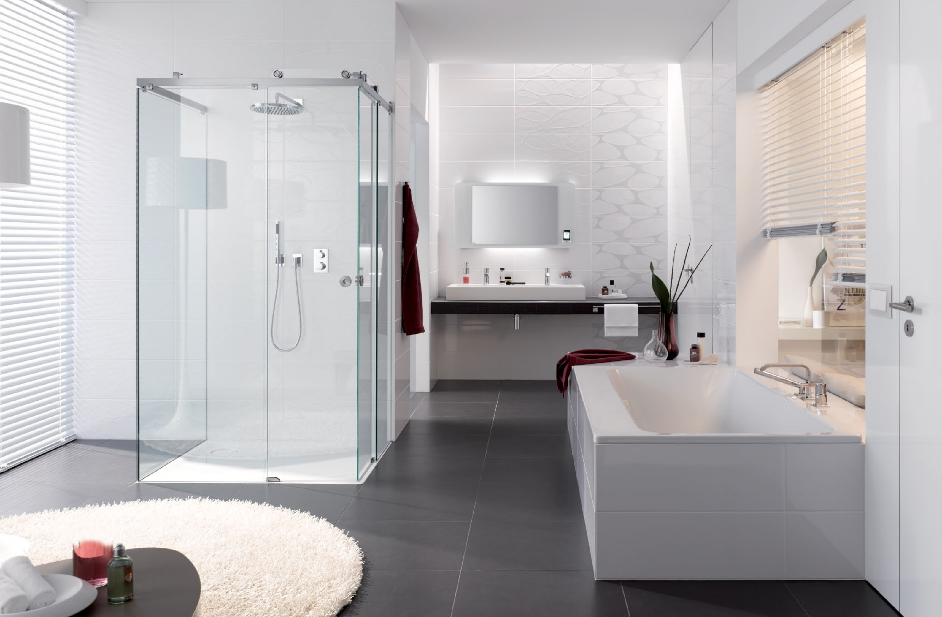
Duschesystem Claro U-Variante mit EckEinstieg