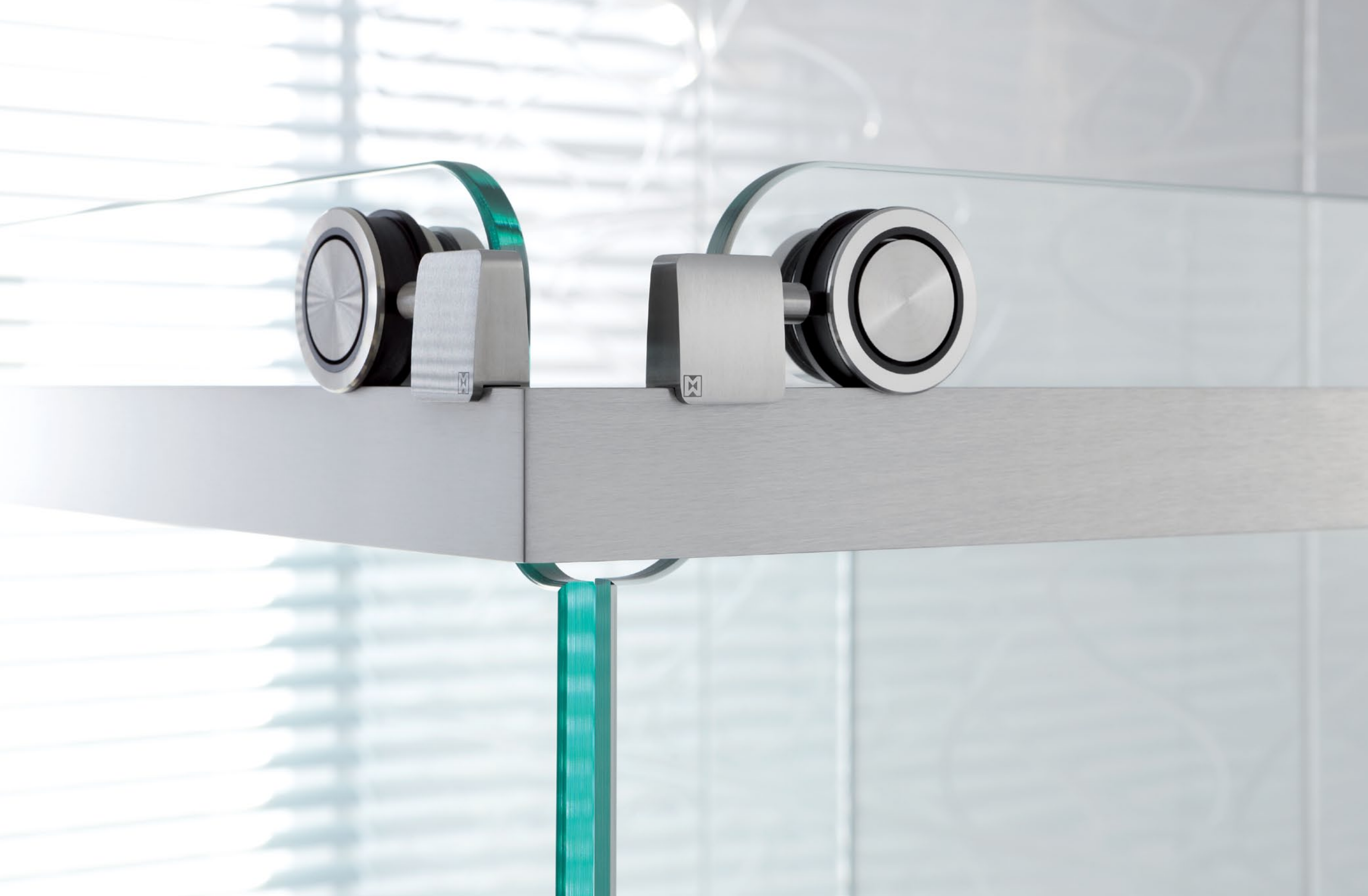
Duschsystem Claro U-Variante mit EckEinstieg